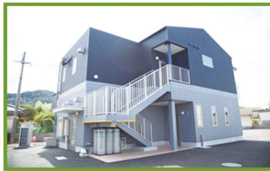
複合施設 りんりん