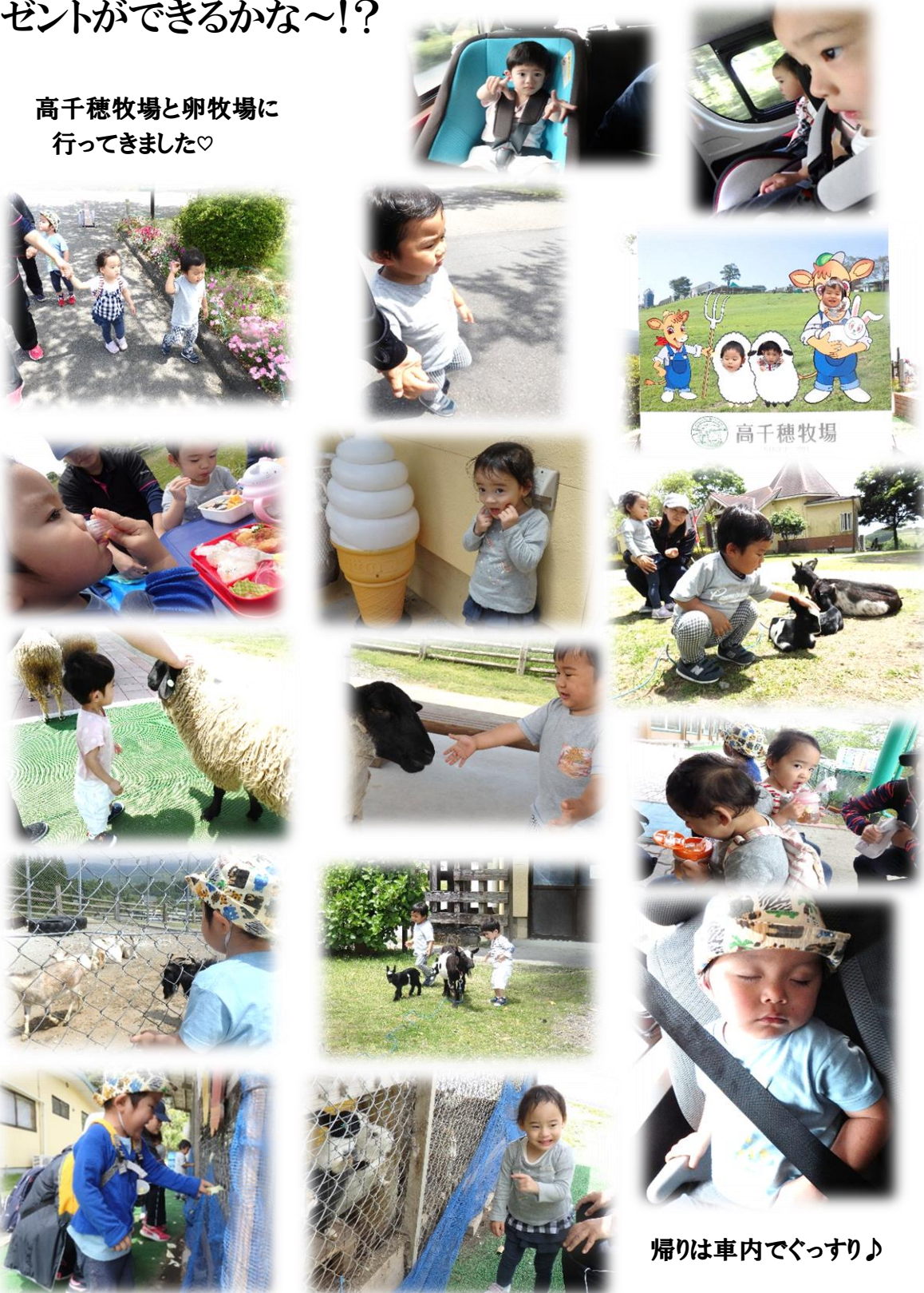
帰りは車内でぐっすり♪